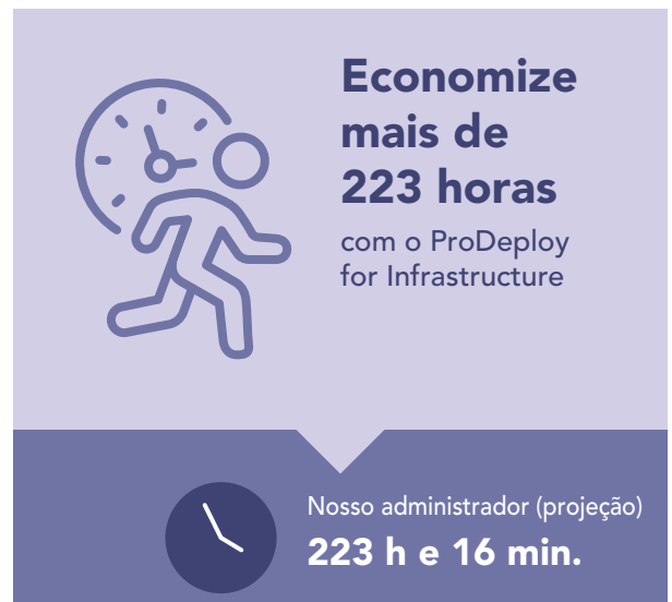
Figura 4: tempo escalonado em horas e minutos e etapas para implantar 100 servidores PowerEdge. Quanto menos, melhor.