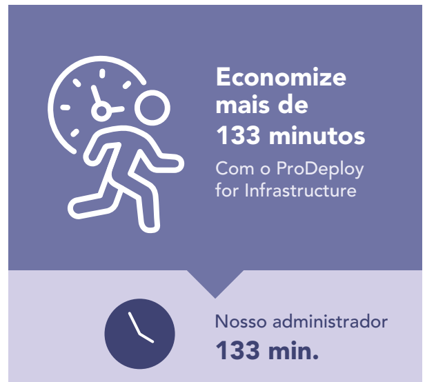
Figura 3: tempo em minutos e etapas para implantar um único servidor PowerEdge. Quanto menos, melhor.

O ProDeploy também pode ajudar implantando servidores grandes ou em várias fases. Para mostrar quanto tempo uma organização poderia economizar utilizando o ProDeploy for Infrastructure em uma instalação de servidores em larga escala, escalamos para 100 servidores o tempo gasto com a implantação de um único servidor Dell PowerEdge R750. Como mostra a Figura 4, permitir que um engenheiro certificado da Dell implante 100 servidores PowerEdge pode economizar mais de 223 horas de trabalho em comparação com a implantação feita por um administrador interno.