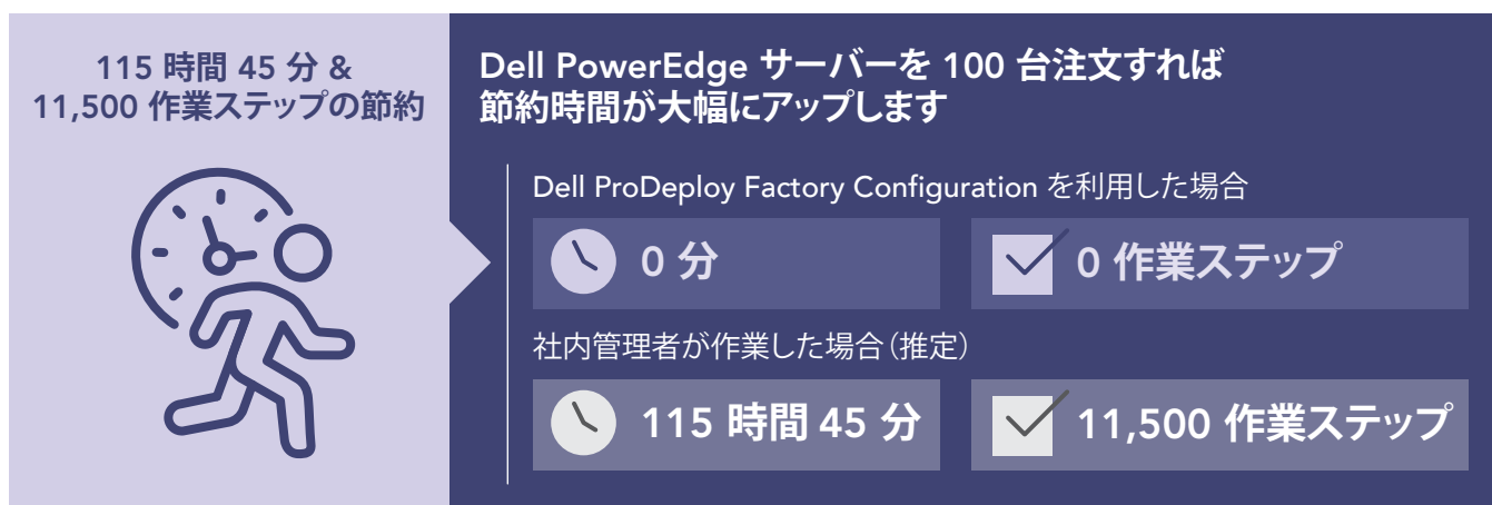
図 2: PowerEdge サーバー 100 台を設定するために必要な社内管理者の時間 (単位: 分) と作業ステップの数 (いずれも推定)。数字が小さいほど企業にとってのメリットは大きくなります。

エンタープライズグレードの企業では頻繁に大量のサーバーの交換が行われ、複数の場所に同じ設定のサーバーを多数配送する必要があることがあります。こういったケースが反映された当社の検証シナリオ 1 では、おそらく ProDeploy Factory Configuration サービスを利用する大きな価値が実証されているかと思えます。大規模なサーバー設置を行う場合に ProDeploy Factory Configuration サービスを利用することで企業が節約できる時間を示すため、当社は PowerEdge R750 サーバー 1 台の設定にかかった時間から、100 台を設定する場合にかかる時間を推定しました。図 2 には、100 台のサーバーすべてをこのサービスを利用して設定した場合に、設置を通してすべてのサーバーの設定の一貫性を徹底しつつ、約 115 時間を節約できる可能性があることが示されています。