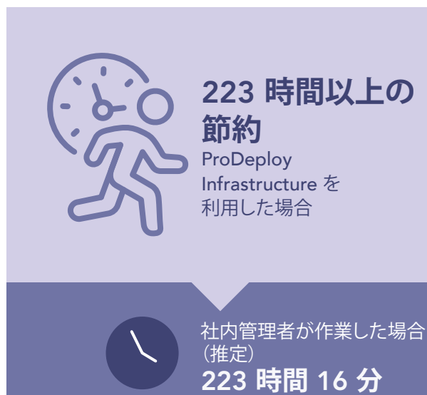
図 4: PowerEdge サーバー 100 台を展開するために必要な時間 (単位:分) と作業ステップの数 (いずれも推定)。数字が小さいほど企業にとってのメリットは大きくなります。