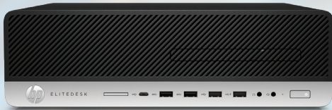
EliteDesk 800 G4 mit 32 GB RAM

Wir führten Aufgaben mit zwei HP EliteDesk 800 G4 Desktops durch: 2