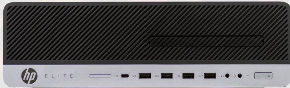
EliteDesk 800 G3 con 32 GB di RAM

Abbiamo eseguito le attività usando due desktop della serie HP EliteDesk 800: 2