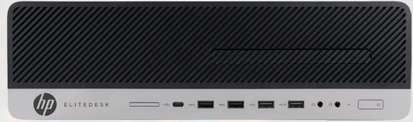
EliteDesk 800 G4 con 16GB di RAM+ 16GB di memoria Intel Optane