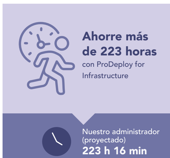
Figura 4: Tiempo extrapolado, en horas y minutos, y pasos para implementar 100 servidores PowerEdge. Mientras menos, mejor.