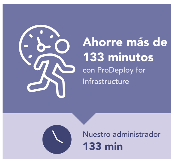
Figura 3: Tiempo, en minutos, y pasos para implementar un único servidor PowerEdge. Mientras menos, mejor.

ProDeploy también puede ayudar con el despliegue de un servidor de gran tamaño o de varias fases al implementar los servidores por usted. Para demostrar cuánto tiempo puede ahorrar una organización con ProDeploy for Infrastructure en una instalación de servidores a gran escala, extrapolamos los tiempos capturados de la implementación de un único servidor Dell PowerEdge R750 a 100 servidores. Como se muestra en la Figura 4, permitir que un ingeniero certificado por Dell implemente 100 servidores PowerEdge para usted podría ahorrar más de 223 horas en comparación con el hecho de que un administrador interno los implemente.